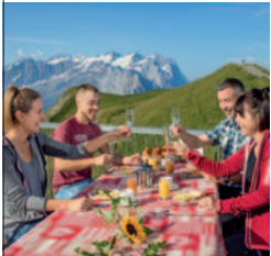
Frühstücksbuffet Alpen tower